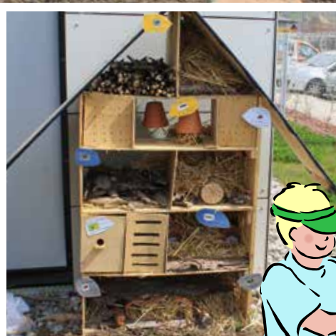
Association loi 1901, agréée et habilitée pour son action : famille / éducation / jeunesse

Association Familles Rurales Accueil de loisirs et périscolaire Chemin de Maise 74140 Douvaine Tél. /Fax : 04 50 94 17 03 Afr.douvaine@wanadoo.fr comite.afrdouvaine@orange.fr http://www.afr-douvaine.com