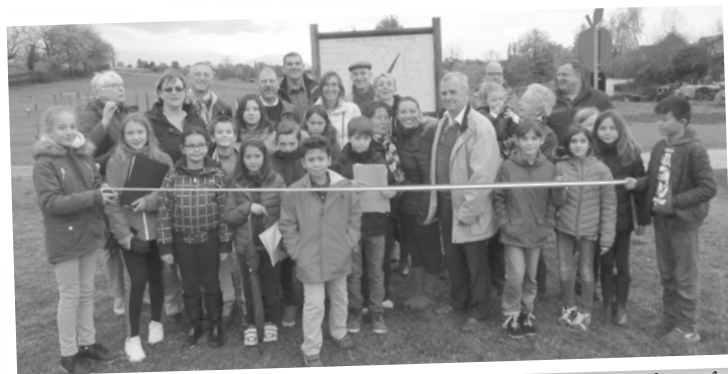
Le Conseil Municipal des jeunes avec leurs aînés pour l'inauguration le 5 novembre dernier.