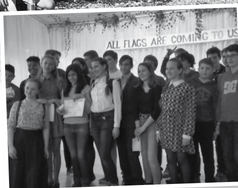
Groupe franco russe bouriate à Baïkalsk

En avril c'est le groupe des élèves du club Unesco, qui avaient reçus leurs correspondants en avril 2016, qui se sont rendus à Irkoutsk, en Sibérie, sur les bords du lac Baïkal. La problématique du Geopark était à l'honneur puisque celui du Chablais parraine la création d'un