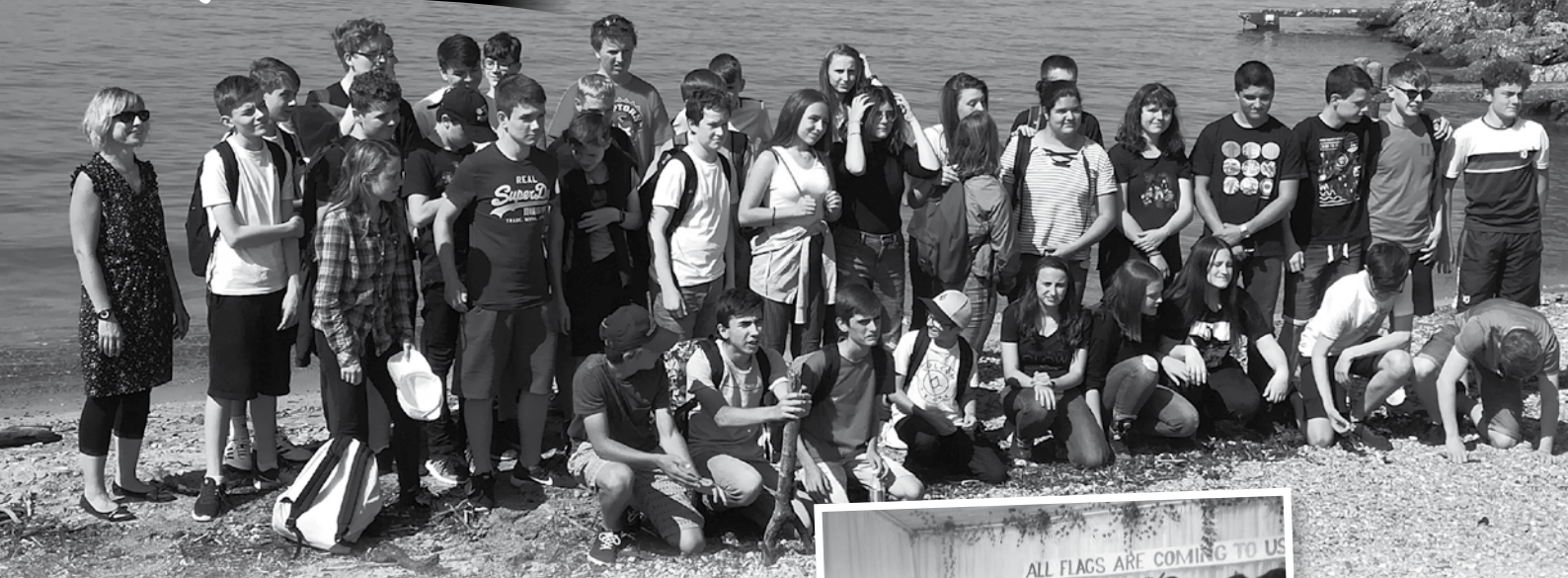
À Nernier le groupe franco irlandais avec le Geopark

“Echanges internationaux au service du dialogue entre les cultures au collège du Bas-Chablais, membre du réSEAU des écoles associées de l'Unesco, et éducation au patrimoine classé Unesco : deux voyages et échanges ont eu lieu lors de cette année scolaire sur ce thème au collège du Bas-Chablais.